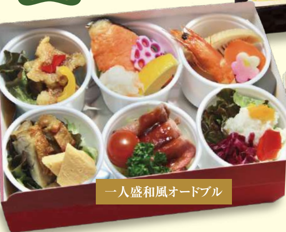
一人盛和風オードブル

[内容]厚焼き玉子・鮭塩焼き・海老旨煮・グリルチキン大根なます・黒豆金粉・煮物(竹の子・がんも・蓮根・人参・海老旨煮・梅麩)・ローストビーフ・ミニトマト・椿スモークサーモン・ブロッコリー・海老チリソース・赤魚南蛮漬