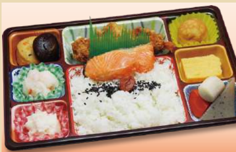
特選幕の内弁当 650円(税込)

[内容]海老フライ、若鶏唐揚げ、焼売、プチケーキ、サーモン塩焼、煮物(季節の煮物5点盛) 他