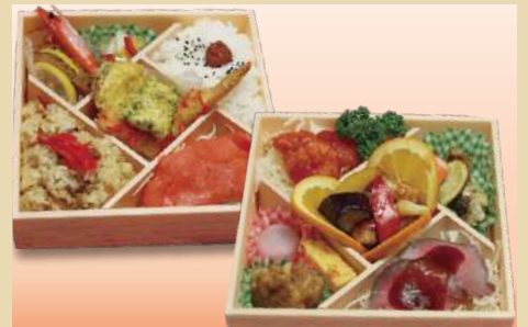
二段重弁当 2,160円(税込)

[内容]赤魚バジル香草焼き、がんも、開きす揚げ、スモークサーモン、酢豚、帆立マヨ焼き、季節のデザート 他