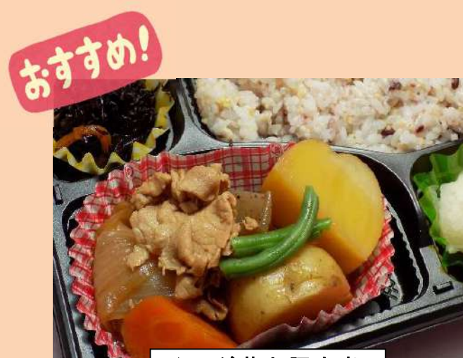
じゃが芋と豚肉煮