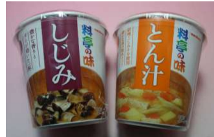
しじみ・とん汁・ほうれん草 各¥120(税込)