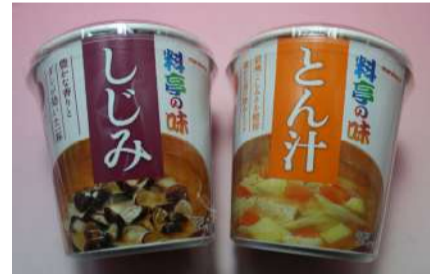
しじみ・とん汁・ほうれん草 各¥120(税込)