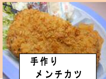
手作り メンチカツ