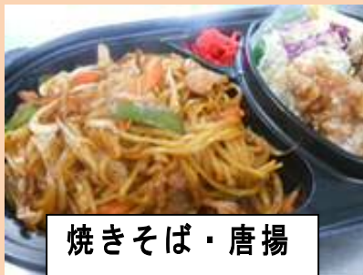
焼きそば・唐揚げ