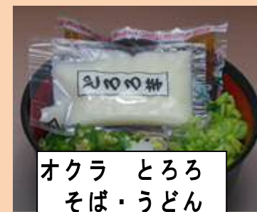
オクラ とろろ そば・うどん