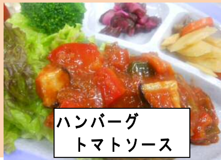
ハンバーグ トマトソース