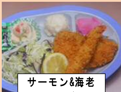
サーモン&海老 フライ